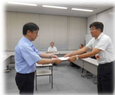
教育長より開設準備委員会委員長に「新設校の開設準備などに関すること」が諮問されました。

※氏名の前に◎が付いている委員が委員長、○が付いている委員が副委員長に選出されました。