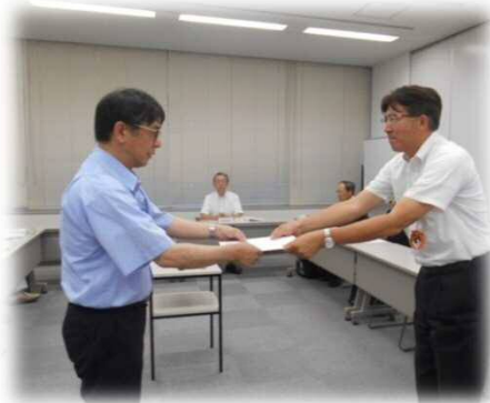
教育長より開設準備委員会委員長に「新設校の開設準備などに関すること」が諮問されました。

※氏名の前に◎が付いている委員が委員長、○が付いている委員が副委員長に選出されました。