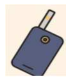
aparelho de cigarro elétrico