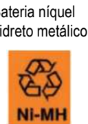
Bateria níquel hidreto metálico

bateria recarregável com as marcas acima