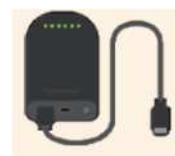
Recarregador de bateria mobile de dispositivos móveis