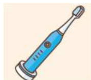
Bateria recarregável integrada de escova de dente elétrica

bateria recarregável com as marcas acima