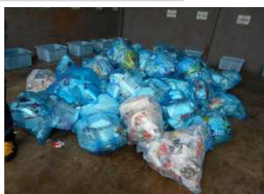
大久伝区から回収した62袋の組成調査を行いました。

分別が分からないものについては、 豊明市公式LINEから簡単検索できます。 ～手順～