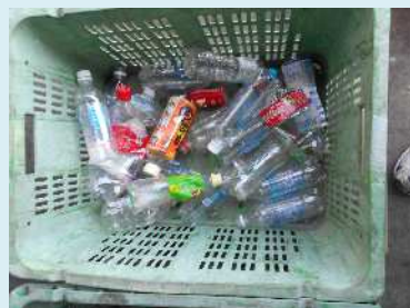
ペットボトルが含まれていました。資源として出してください。