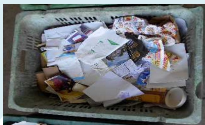
資源として出せる紙製容器包装が含まれていました。資源としてだしてください。