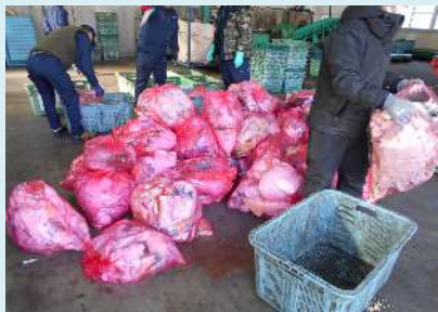
50袋を収集し、調査を行いました。