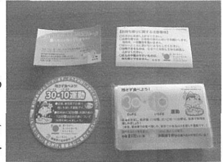
30・10運動の啓発グッズ