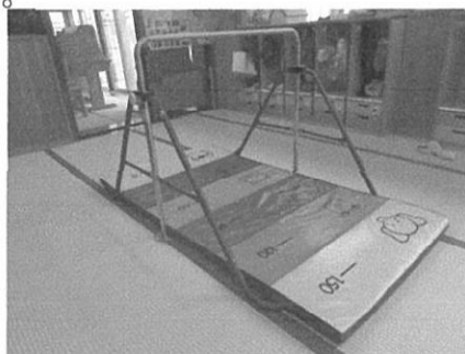
運動遊びに使用される器具