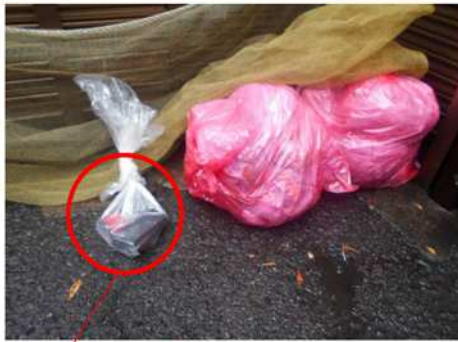
可燃ごみの袋の横に、別袋で出してください。

○ 中身の見える無色透明な袋(市販の袋やジッパー付のビニール袋など) に入れて出してください。 ※燃えるごみの赤い袋に入れしないでください！収集車の火災の原因になります。