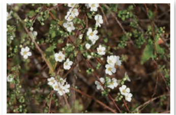
例年3月下旬~4月上旬が見ごろのユキヤナギ