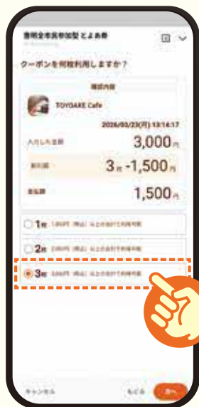
5 商品券の利用枚数の選択 ※誤って利用済みにした商品券は元に戻せません