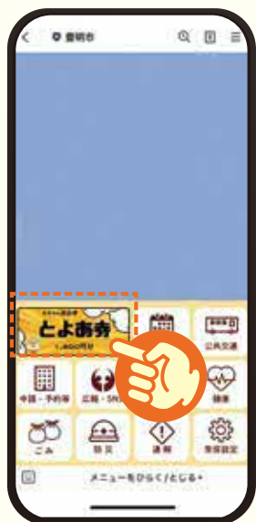
1 豊明市のLINE公式アカウントのタブから「とよあ券」を押す