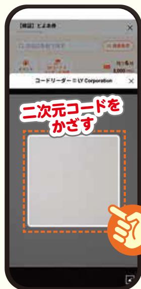
3 店舗設置の二次元コードを読み込む