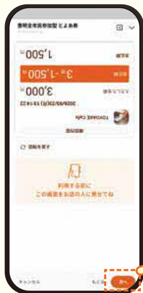
6 店舗スタッフに画面を見せてから、「次へ」を押す 利用完了のメッセージが表示されます ※必ず店舗スタッフの確認を受けてください 確認がない場合、無効となる場合があります