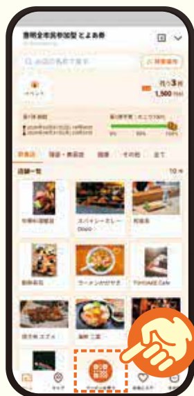
2 中央下部の「クーポンをつかう」を押す