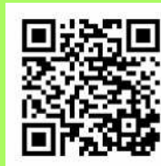
とよあけ検診ガイド