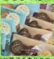
⑮お菓子の森ルミエール