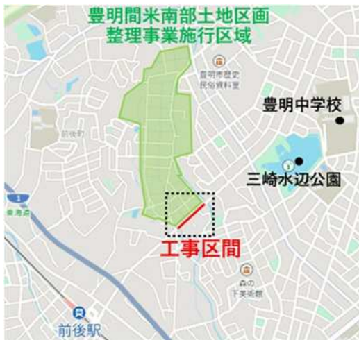
桜ヶ丘沓掛線改修工事 令和8年度工程表