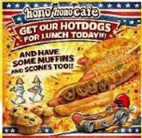
④hono hono cafe