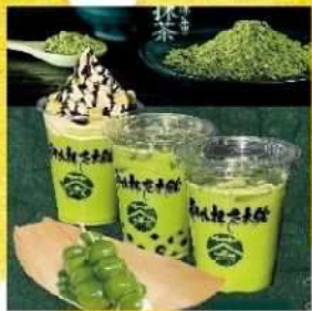
①利休抹茶本舗六代目