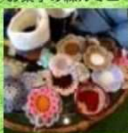
⑯雑貨と植物カミルレ