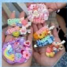
⑳M's Handmade Shop ホイップピン作り 600円(税込)