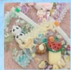
㉔Lumi Fuwa オリジナル キーホルダー 作り