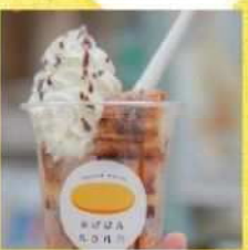
⑫あげパン non 乃