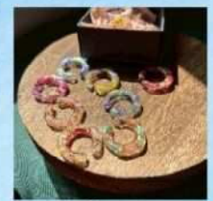
㉑enn オリジナル シール作り 500円(税込)