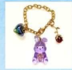
㉒HANA*TORIDORI バッグチャーム作り 400円(税込)~