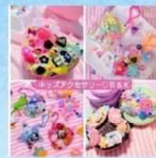
㉓R&K ホイップデコ キーホルダー作り