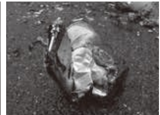
2021年5月 モバイルバッテリー