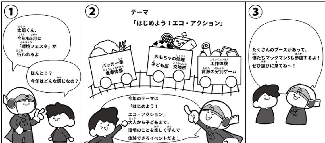
絵：豊明高等学校イラストレーション部 伊藤亜美さん

環境課では区・町内会で行う清掃活動に対して、ごみ袋の提供や集めたごみの回収をサポートしています。ぜひご活用ください(事前に申請が必要です)。