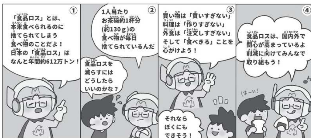
絵：豊明高校イラストレーション部 大島優奈さん