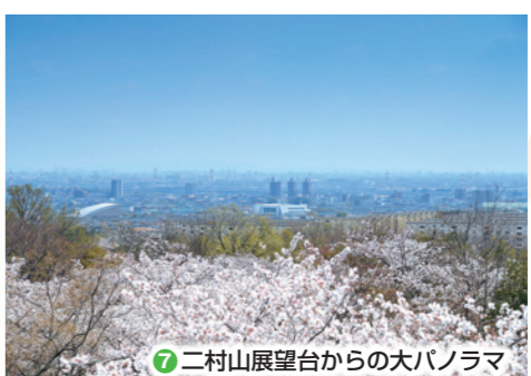
⑦ 二村山展望台からの大パノラマ