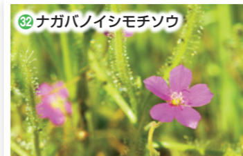
32 ナガバノイシモチソウ