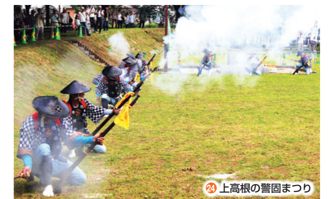
24 上高根の警固まつり