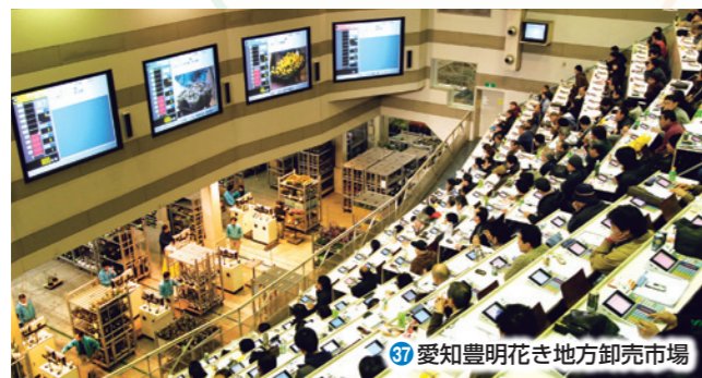
37 愛知豊明花き地方卸売市場