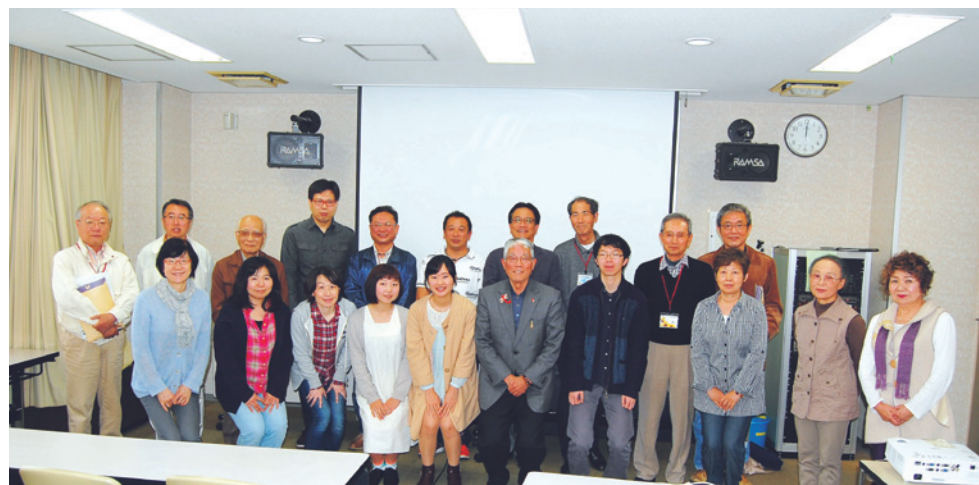
まちの未来を描き隊 第6回全体会

計画策定にあたり多大なるご尽力をいただきましたまちの未来を描き隊を始め、地域別計画やグループインタビュー、市民アンケートにご協力いただきました市民の皆さま、熱心にご審議いただきました総合計画審議会の皆さま、市議会並びに関係機関の皆さまに、心より御礼申し上げます。多くの市民の皆さまが参加し、議論を重ねて、第5次豊明市総合計画の策定に至りましたことを嬉しく思います。