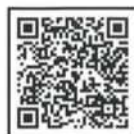
豊明市 リユースショップ 一覧(QRコード)

リユースの取組を広げるため、豊明市に協力していただいている店舗などです。ぜひリユースショップに持ち込むことを検討してください！