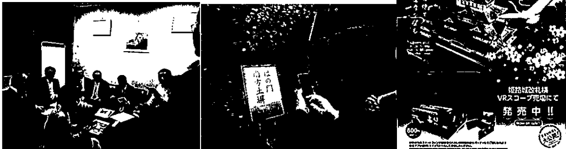
入場時に購入できる姫路城 VR スコープ (写真右)

VRを活用した姫路城の新たな演出とは、姫路城の空撮映像を使って、上空から俯瞰しているかのような疑似体験ができ、スマートフォンやタブレットに表示されるアプリの専用コンテンツを紙製ヘッドマウントディスプレイのレンズ越しに視聴することで、リアリティのある立体映像を体験することができる。