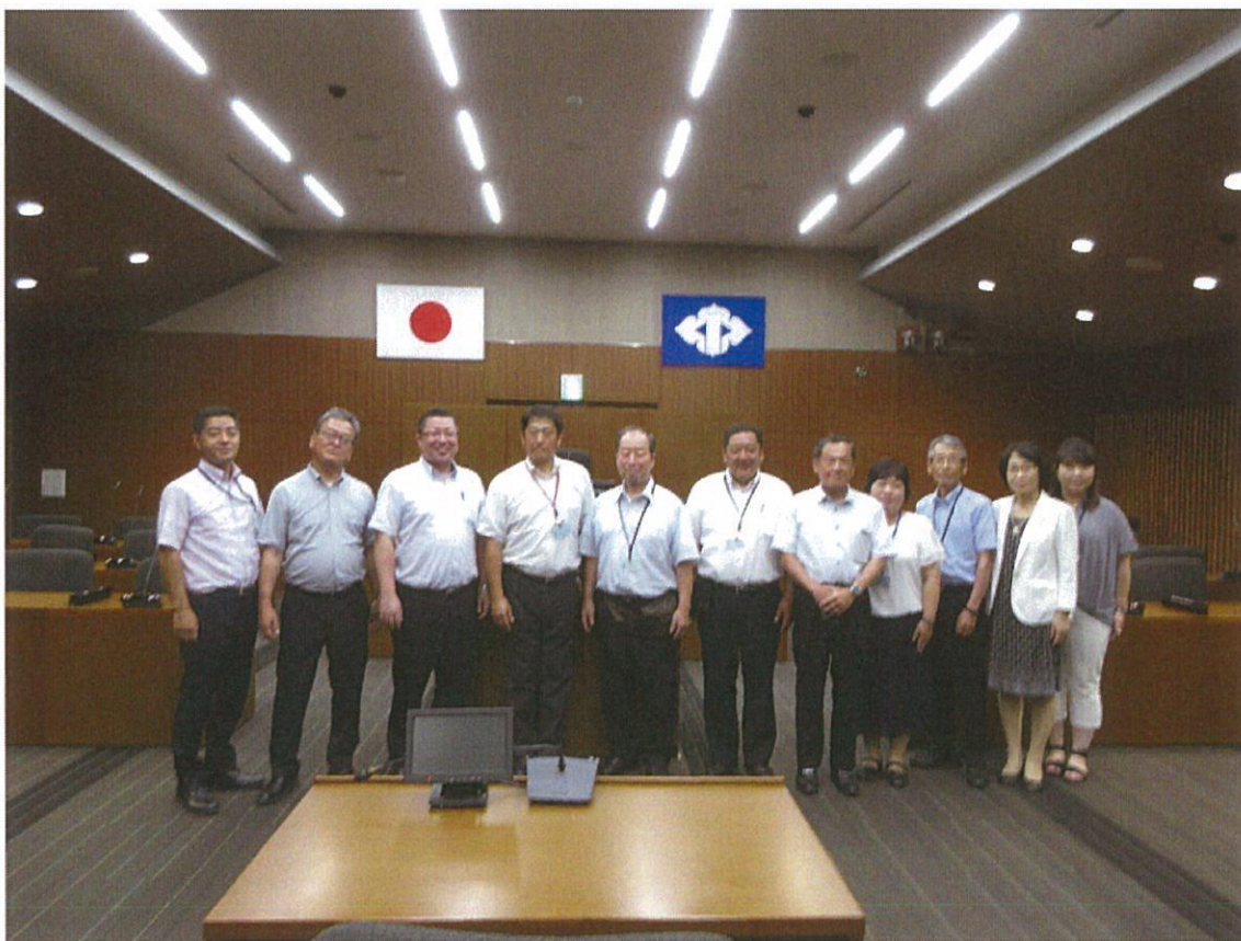
高梁市 議場にて (会派 清風、清和、公明党)

現場での生の声は大変興味深いものがあった。また、防災ラジオ整備事業として、ポケットベルの空き周波数を利用した、防災ラジオを各戸への配布は、当市でも検討していきたい事業であった。