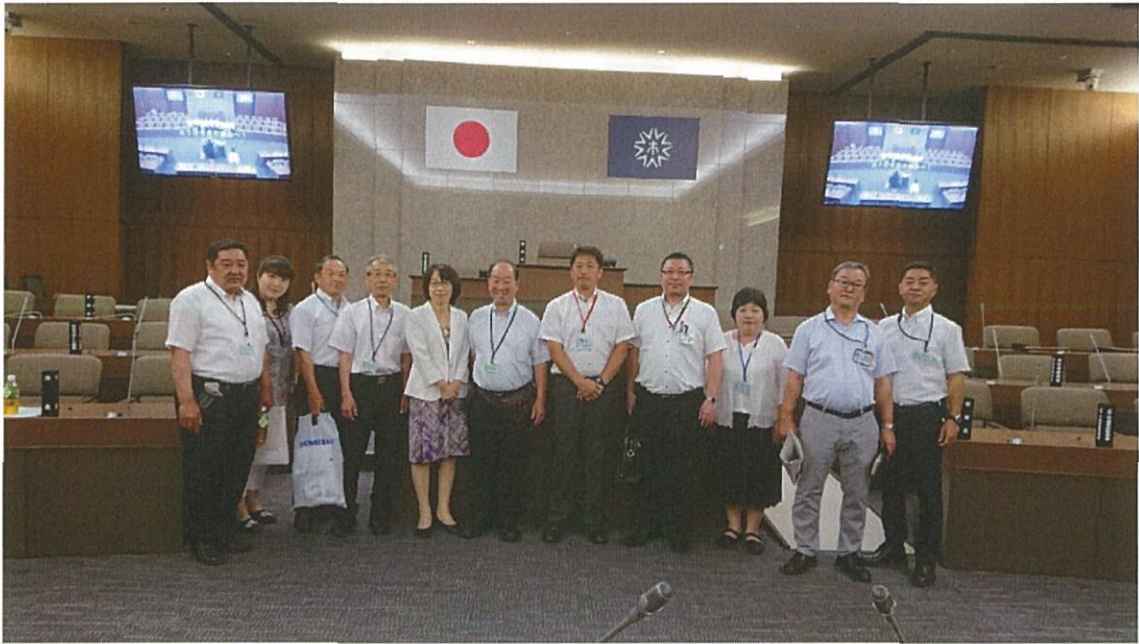
呉市 議場にて（会派 清風、清和、公明党）