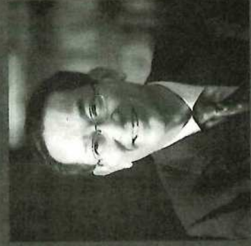
早稲田大学マニフェスト研究所顧問