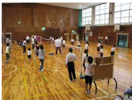
スポーツイベント

スポーツ活動の振興を図るため、スポーツに取り組む各種団体の自主的な活動を支援するとともに、各種団体と連携・協働した取り組みを積極的に実施し、スポーツ・レクリエーション活動を推進します。また、指定管理者との連携を図ります。