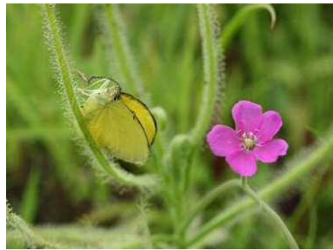
県指定天然記念物 ナガバノイシモチソウ 一般公開