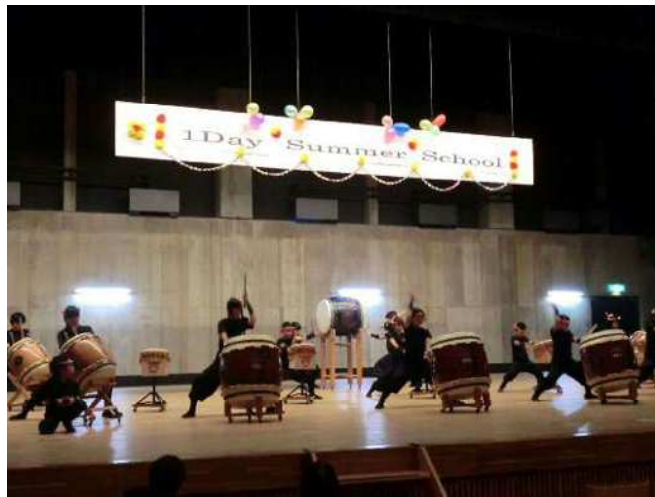
とよあけ市民大学「ひまわり」 1Day Summer School