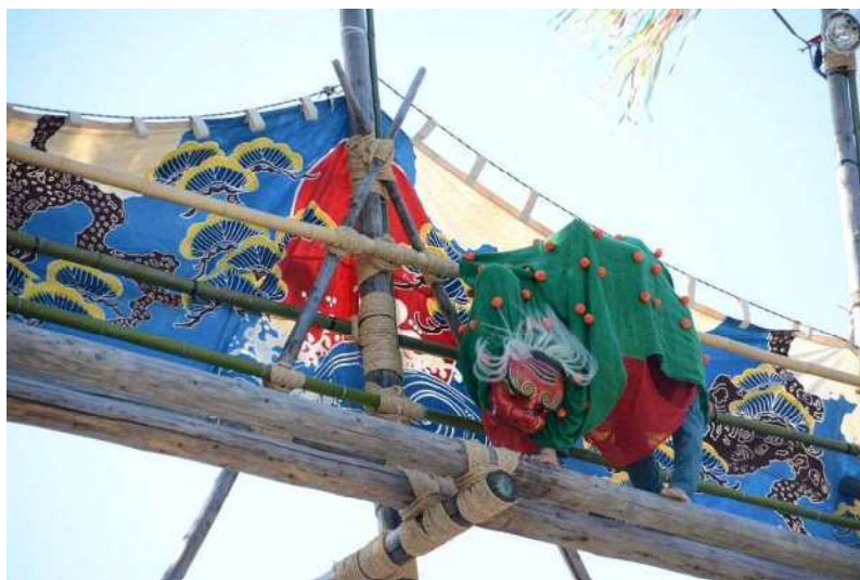
県指定 無形民俗文化財 大脇梯子獅子