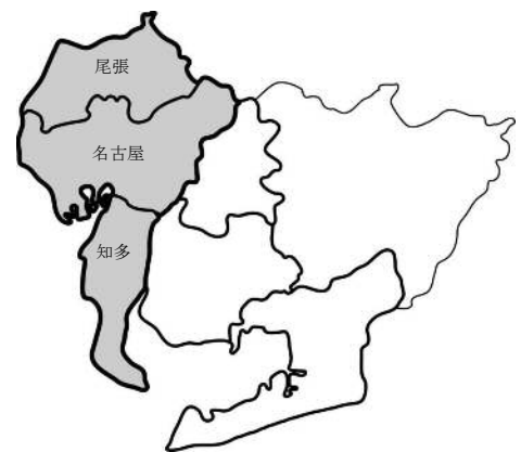
図-尾張広域都市計画圏