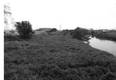
近年、除草されていない二級河川境川の河川敷

問 堤防除草工について。堤防の表と裏法面の部分を原則年1回、7月下旬から10月下旬に実施している。河川敷が公園等で占用されている場合は公園管理者が行う。竹や樹木の伐採・除去は、治水上、雑木が著しい河川障害となる場合、雑木が民地等に支障を来している場合、河川管理上、伐採する必要がある場合に限りて予算範囲内で優先度を勘案し、伐採する。他に要望の必要がある場合はその都度管理者に要望する。