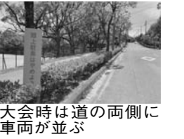
道の両側に車が並ぶ時は大会開催時に駐車場の不足している現状について、その対応は。

問 勅使スポーツ施設で大きな大会開催時に駐車場の不足している現状について、その対応は。