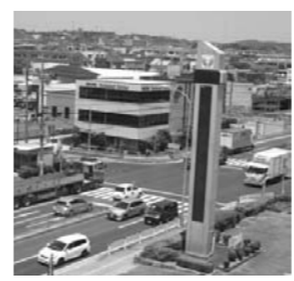
危険が潜む交差点(市役所前)

て、豊明市は1時間あたり補助が400円だが、同じサービスを利用して、大府市では1時間800円の補助が出ている。市が行ったニース調査でも市民から利用料金が高いという回答があったが、補助金額の見直しはできないか。