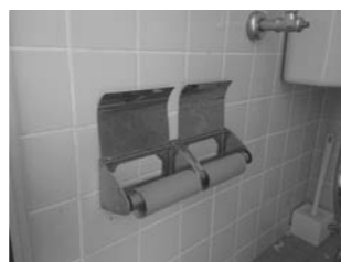
豊明市内の公園にて

問 トイレトーパーを置くことはできないか。 答 ペーパーがないことが浸透していると考えているため現在のところ設置は考えていない。 問 キャッシュレス決済 問 キャッシュレス決済に対する考えは。 答 ひまわりバス、チョイソコとよあけでは、交通系のICカードによる支払いが可能。キャッシュレス決済により事務の軽減につながっている。 問 キャッシュレス決済導入の可能性は。 答 先進事例や近隣自治体の状況を鑑み、メリット・デメリットを勘案しながら研究していきたい。