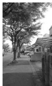
住宅にまで伸びた枝

問 市民の皆様にご協力頂いている大事な事業で、積極的に広報していきたいです。その他にも健康長寿課所管で「とよあけ健康大金星マイレージ」という制度もあります。 答 フラワーボランティア 問 ボランティア登録者も高齢で少なくなっている現在、募集はどのように行われているのか。 答 チラシ配布・広報掲載・募集看板の設置です。 問 「花育」として、公共花壇に、子どもに花を植えてもらい、育てる喜びを感じてもらおうのも教育の一つではないか。 答 園庭・校庭でも花を植えているので、公共花壇までは手が回らないと思います。