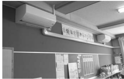
エアコン設置状況（三崎小学校）