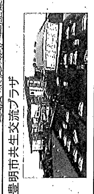
豊明市共生交流プラザ