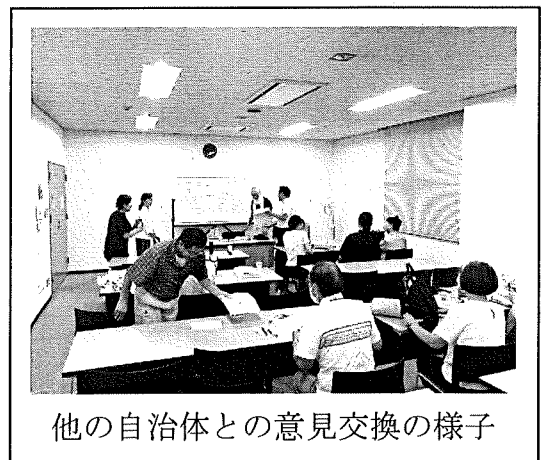
他の自治体との意見交換の様子

勉強会後も、会派内で細かく実績報告書や監査意見書を読み込み、打ち合わせを行って、決算審査に臨みました。