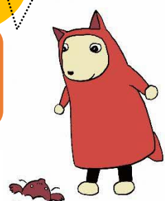
介護サービス相談・地域づくり連絡会 キャラクター “クーちゃん”